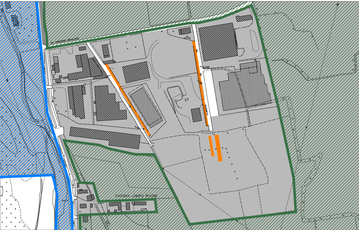
ZONA PRODUTTIVA VIA VENEZIANA BADALASCO - scala 1:5.000