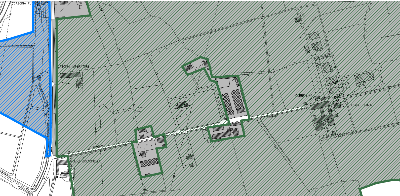
CORBELLINA - scala 1:5.000